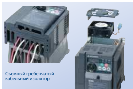
Съемный гребенчатый кабельный изолятор

Электромонтаж и замена вентилятора — без проблем