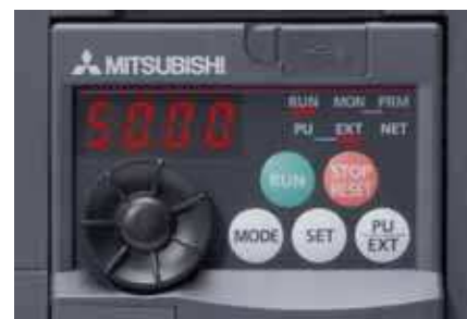
Встроенная панель управления с поворотным пультом управления

Благодаря встроенному поворотному пульту управления пользователь получает более быстрый непосредственный доступ ко всем важнейшим параметрам — по сравнению с традиционными кнопочными системами управления.