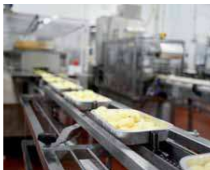
Ленточные и цепные конвейеры — идеальная область применения для FR-D700.