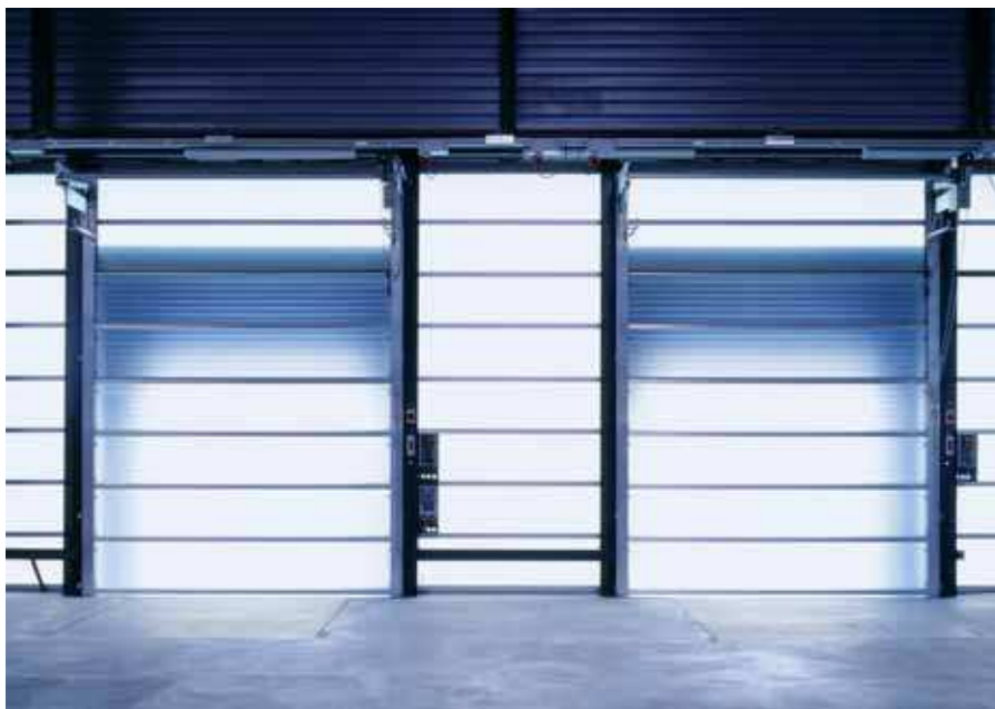
Приводы дверей и ворот — это лишь одна из многих областей применения преобразователей частоты новой серии FR-D700.